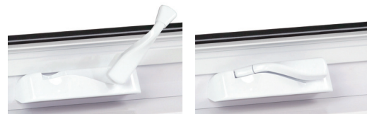
Option de manivelles pliantes disponible, incluant le nouveau système Encore illustré ci-dessus.